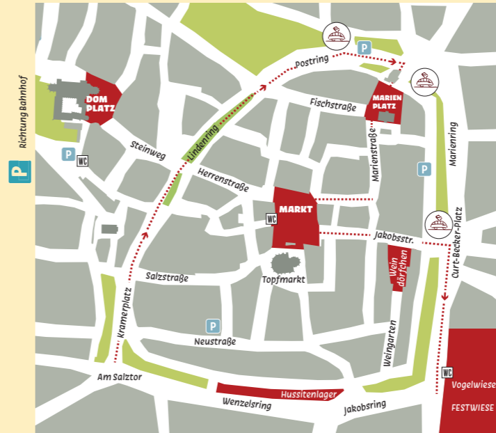
... Verlauf Festumzug barrierefreie Zugänge gewährleistet

Tourist-Information Markt 6 • 06618 Naumburg • Tel. 03445 273 125 • www.naumburg.de